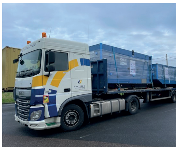
Camion semi-remorque transportant des générateurs vers la Moldavie